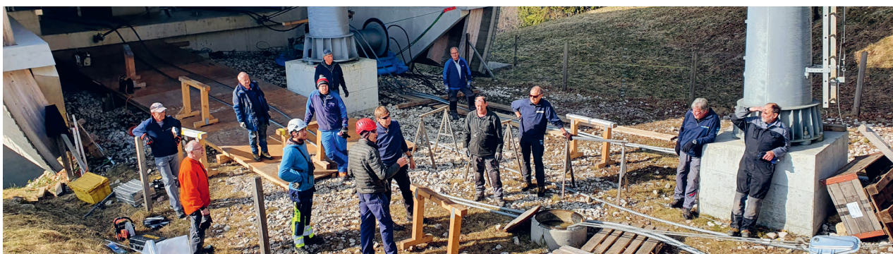
Impressionen zum Förderseilwechsel 2. Sektion, im März 2022