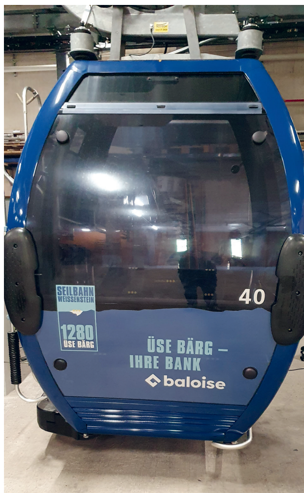
Neufolierung der 21 Baloise-Gondeln im Oktober 2022