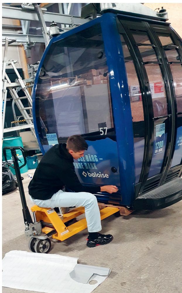
Konzernübergreifendes Rebranding Projekt der Baloise