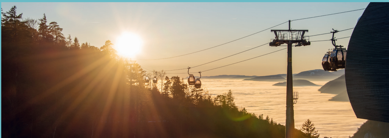
Nesselboden – Sonnenuntergang im Dezember